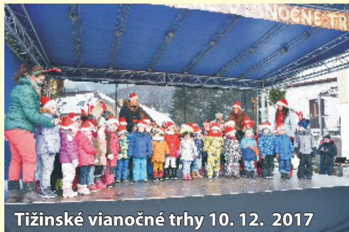
Tižinské vianočné trhy 10. 12. 2017

Zo Žiliny do Terchovej napravo je odbočka. Rád sa vraciam k svojej rodnej, do rodného hniezdočka.