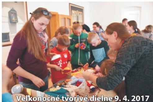
Velkonočné tvorivé dielne 9. 4. 2017