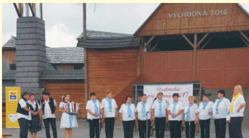
Jednota dôchodcov na súťaži vo Východnej