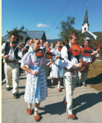
Tižinské hody 1. 10. 2017