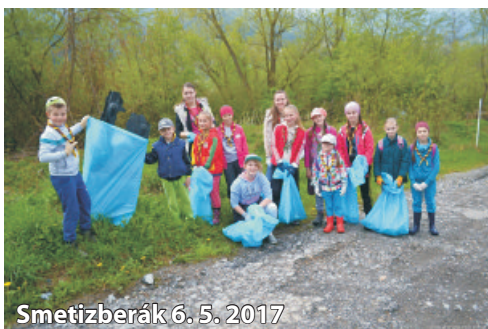
Smetizberák 6. 5. 2017