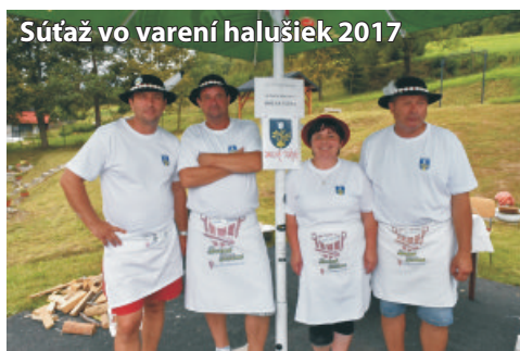
Súťaž vo varení halušiek 2017