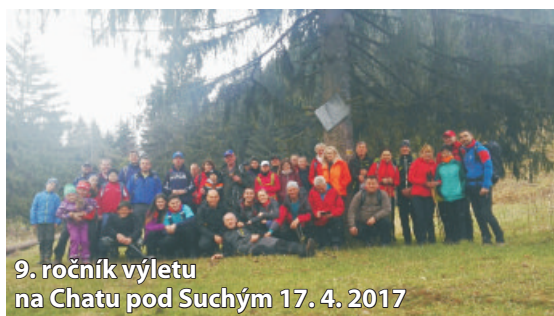
9. ročník výletu na Chatu pod Suchým 17. 4. 2017