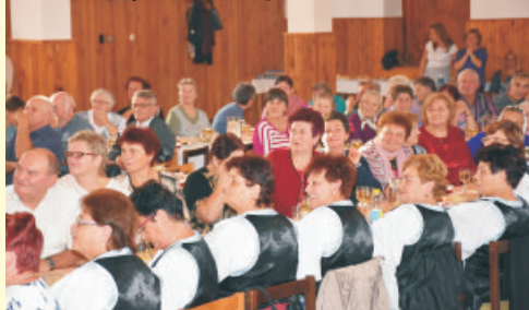
Mesiac úcty k starším - posedenie 18. 10. 2017