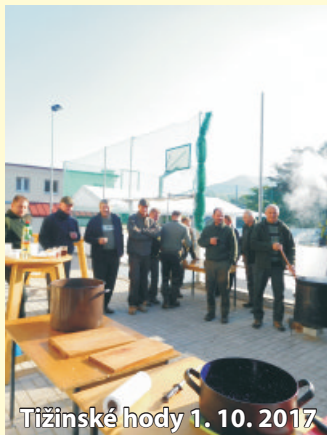
Tižinské hody 1. 10. 2017