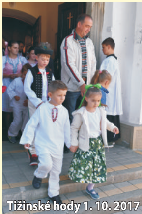
Tižinské hody 1. 10. 2017