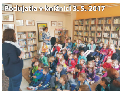
Podujatia v knižnici 3. 5. 2017