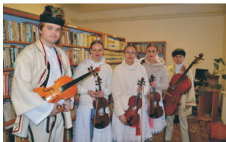
Dorastajúca generácia Tižinskej muziky

Neodmysliteľnou súčasťou každého podujatia je ľudová muzika a speváčky v tradičných krojoch. Stará partia, mladšia partia, deti, ženy vytvárajú krásny celok, na ktorý môžeme byť právom hrdí! „Veď na všetko, čo sa deje okolo nás je pieseň.“ Jasličková pobožnosť spojená s koledami, hodové piesne, smútočné, ľúbezné... Započúvať sa do slov každej z nich je pohladením pre všetky generácie.