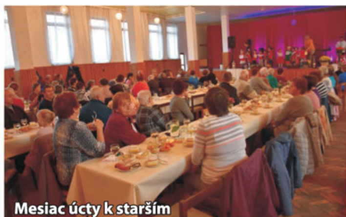
Mesiac úcty k starším