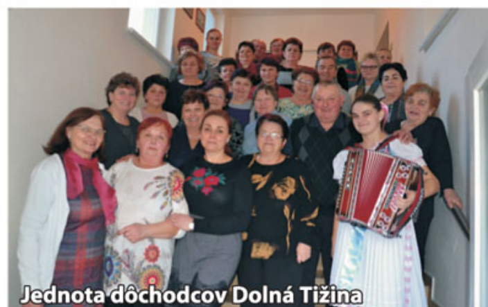
Jednota dôchodcov Dolná Tižina

Podakovanie za účasť, pomoc a reprezentáciu pri podujatiach patrí všetkým zložkám v obci, menovite Materskej škole, Základnej škole, Farskému úradu, Jednote dôchodcov Dolná Tižina, Dobrovoľnému hasičskému zboru Dolná Tižina, 111. skautskému zboru Úsmev Dolná Tižina, Poľovníckej spoločnosti Kriváň - Malá Fatra, Futbalovému klubu Fatran Dolná Tižina, folkóristom, hudobníkom i všetkým aktivistom.