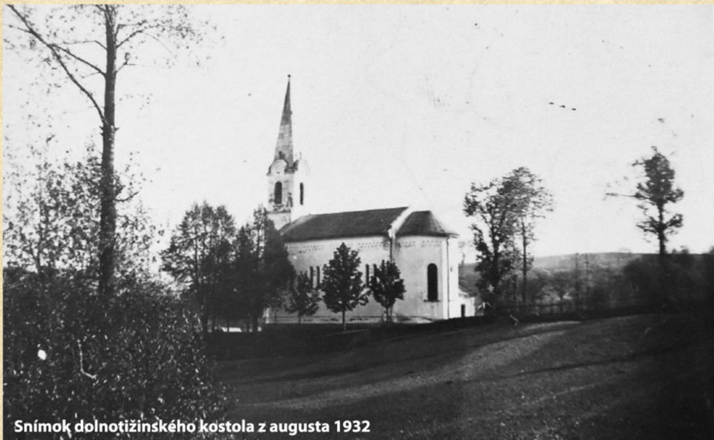
Snímok dolnotižinského kostola z augusta 1932

Lokálna kaplánka Tižina s filiálkou Zemianska Stráža, ktorú zriadili v roku 1789, bola kráľovským dekrétom cisára Františka povýšená na farnosť 20. apríla 1805. Do roku 1789 patrili Tižina a Strassa do Varínskej farnosti. V súčasnosti farnosť Dolná Tižina s filiálkou Stráža patrí do Žilinskej diecézy, do ktorej bola včlenená 14. februára 2008, kedy pápež Benedikt XVI. podpísal dekrét o zreorganizovaní diecéz na Slovensku. Žilinská diecéza vznikla odčlenením niektorých farností z Nitrianskej a Banskobystrickej diecézy. Do roku 2007 patrila farnosť Dolná Tižina pod Nitriansku diecézu. Od roku 2007 spadá do Varínskeho dekanátu.