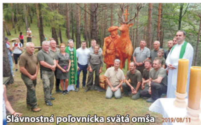
Slávnostná poľovnícka svätá omša 2019/08/11