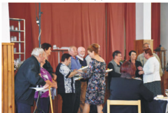
Mesiac úcty k starším 2018