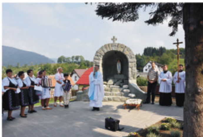
Posvätenie novej kaplnky pri kostole