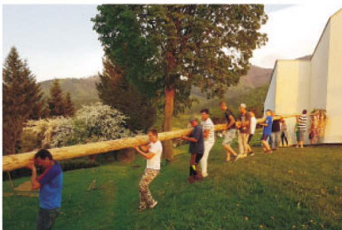
Stavanie mája 2018