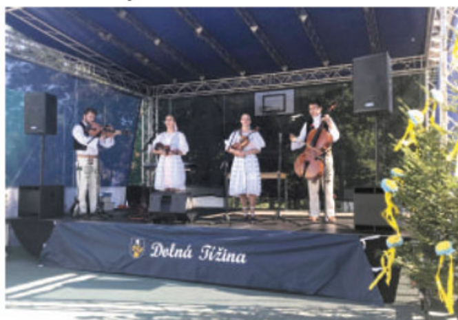
Tižinské hody 2018